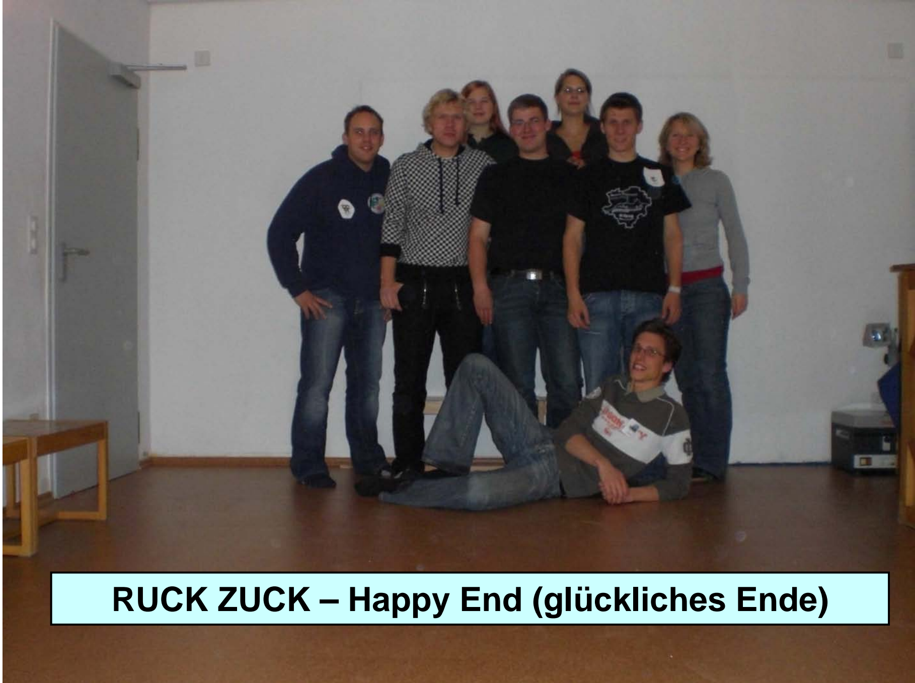
RUCK ZUCK – Happy End (glückliches Ende)